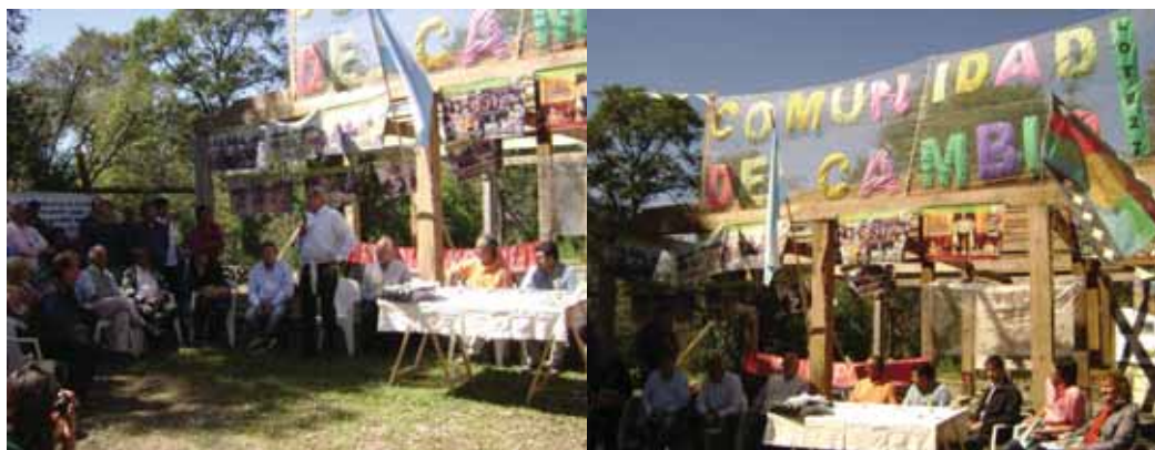
Fotos: Autoridades provinciales y municipales conversando con los/as Sin Techo.

palabras el gobernador Jorge Sapag comenzó su alocución. Se comprometió a enviar los materiales para las primeras doce casas, de una primera etapa de 25 que se quieren realizar (el 10% del total de las casas que se proyectan para el futuro barrio). El presidente de Sin Techo lo interpeló, preguntándole si iban a firmar algún acta que certificase lo que estaba diciendo dado que “el Estado siempre hace lo mismo, promete pero después no cumple” . A su vez, le dijo que debía tenerse presente que ellos querían construir sus casas bajo la forma legal de una cooperativa de trabajo. Sapag le respondió que ellos no se habían comprometido a firmar ningún acta y que no la podrían realizar en ese momento, pero dijo que sí se comprometía a poner el dinero para las primeras doce casas y que, si iban a ser autoconstruidas, ello requeriría de otro dinero y que lo hablarían a futuro. Posteriormente, fueron a comer choripanes. Luego de la comida realizaron un recorrido por el predio y, cuando lo estaban finalizando, el presidente de Sin Techo le pidió al Gobernador que tuviera en cuenta que el hecho de que las viviendas fueran a ser autoconstruidas, implicaría que quienes fueran a construir-