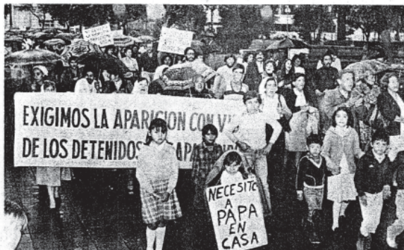
NIÑOS CON CARTELES que los identifican como hijos de desaparecidos encabezan la marcha que se realizó ayer.

Bajo una lluvia persistente, se realizó ayer una marcha pública para reclamar por la aparición con vida de los desaparecidos y, a la vez, en apoyo a la entrega, en Buenos Aires, de un petitorio ante las autoridades nacionales en ese sentido. La manifestación organizada por las madres de los desaparecidos de Tucumán, concentró a más de 500 personas que durante una hora marcharon alrededor de la plaza In-