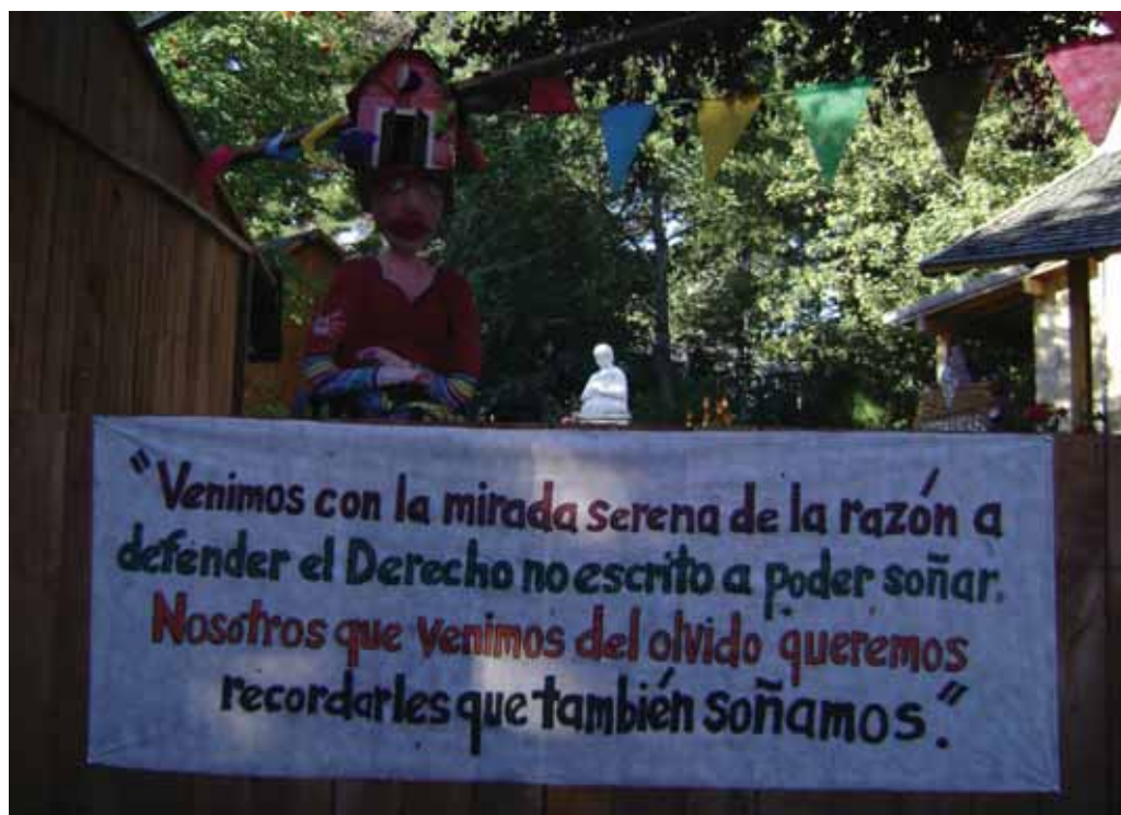
Foto: Venimos a recordarles que también soñamos.

solidaridad, unión, esfuerzo, lucha, amor. En el techo de la misma, un cartel decía: primer Barrio Intercultural. Vecinos sin techo y por una vivienda digna. Luego una segunda camioneta, absolutamente “disfrazada” de casa con la leyenda hacer viviendas dignas es repartir la riqueza. Le siguió un tractor verde que llevaba un carro repleto de flores y plantas, el cual estaba acompañado por los/a encargados/a del vivero comunitario, que iban caminando. Entre el carro y el tractor se encontraba un cartel en letras rojas que decía seguimos en la lucha sin bajar los brazos. Posteriormente pasó frente al palco oficial otra “camioneta disfrazada de casa” con la leyenda 2.500 familias necesitan solución ahora. Políticas públicas ya. Esta última acarrea otro carro, decorado con globos y banderines, en el cual se encon-