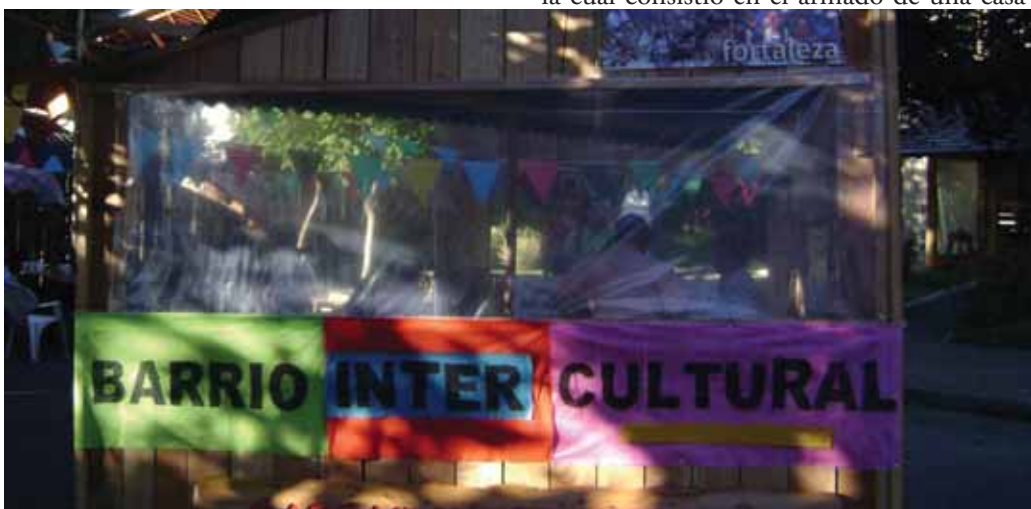
Foto: Frente del stand del Barrio Intercultural, comunidad de cambio.

Mediante la subsecretaría de desarrollo urbano y vivienda del municipio consiguieron que un arquitecto les brindara apoyo técnico para la realización de la muestra, la cual consistió en el armado de una casa