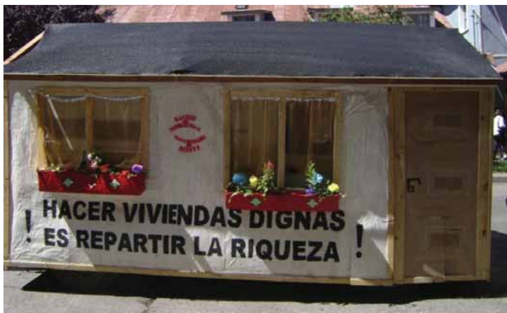
Foto: Hacer viviendas dignas es repartir la riqueza.

en las esquina de la calle Juan Manuel de Rosas, frente a la secretaría de turismo de la ciudad y a pocos metros de la avenida San Martín. Esta casa comenzó a ser visitada por turistas y habitantes de la ciudad. Ese mismo día el secretario de cultura de la nación, el de turismo del municipio y el subsecretario de vivienda de la ciudad se hicieron presentes y visitaron el stand . El domingo a las 10 de la mañana, un grupo de ocho personas comenzamos a poner fotos, afiches, sonido y luz en la casa, mientras los demás integrantes de los/as Sin Techo continuaban en la radio armando la puesta en escena para el día lunes. Armaron un decorado con forma de casa en tres camionetas traffics que tenían las siguientes leyendas: construir viviendas es repartir la riqueza y 2500 familias necesitan solución ahora. Políticas públicas ya . A su vez, hicieron disfraces de casas los cuales fueron utilizados por algunas de sus integrantes. También