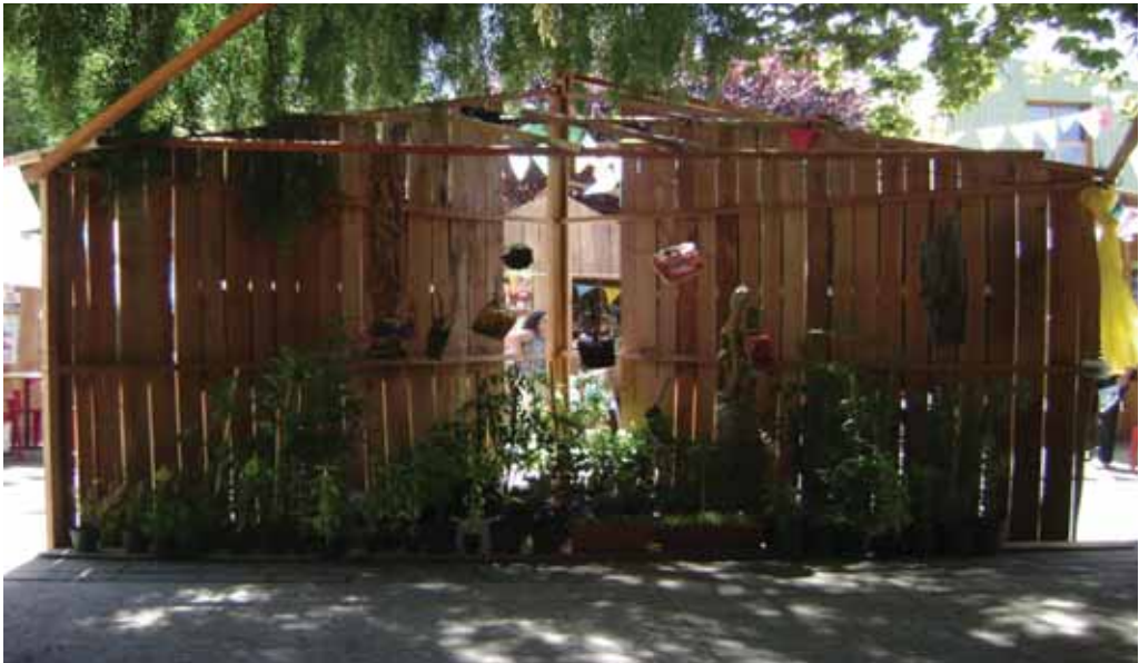
Foto: Exhibición del vivero comunitario.

queta y consiguieron un carro para poder mostrarla en el evento, junto a las plantas que siembran en el invernáculo, algunas de las cuales fueron exhibidas en el stand que armaron para el 4 de febrero. El objetivo de la organización era mostrarlo, porque tienen previsto realizar cuatro invernáculos